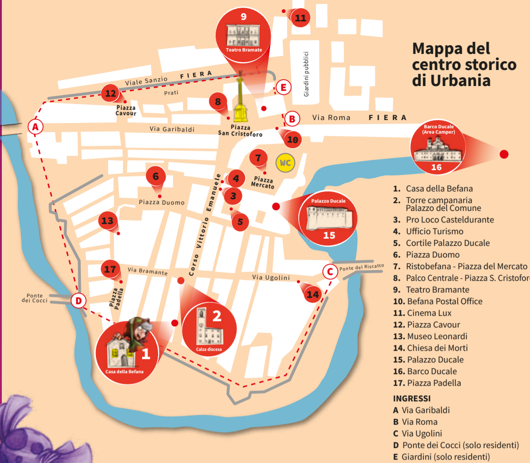
Mappa del centro storico di Urbina

Si ripetono i giochi e le animazioni della mattina precedente, con l'aggiunta di un fantastico spettacolo di Falconeria , dove questi splendidi uccelli potranno essere ammirati e toccati senza alcun pericolo (a cura di worldwildfalconeria). Inoltre, per tutto il giorno in Via Raffaello Sanzio, il Labirinto della Befana a cura del Picchio Verde. Nel pomeriggio, di nuovo il Mago delle Bolle e lo spettacolo di Bimbobell , con gag, musica, piccole magie e giochi interattivi di abilità, di astuzia e di fantasia. Di nuovo: la Befana volante, la sfilata